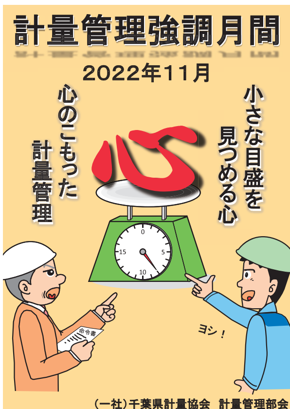
ポスター特賞 古屋 俊樹