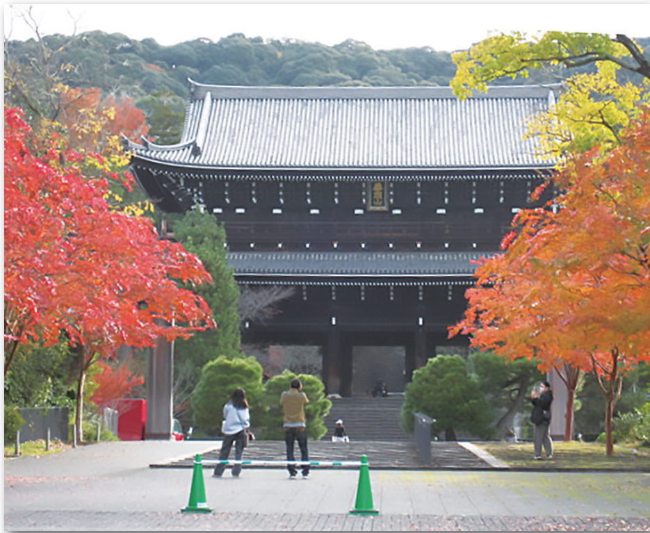
(京都市 知恩院門前)