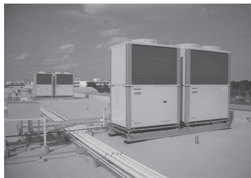
ガス空調設備(GHP)の室外機取り付け