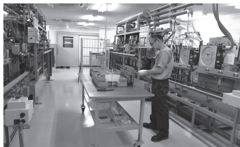
ガスメーターの検定