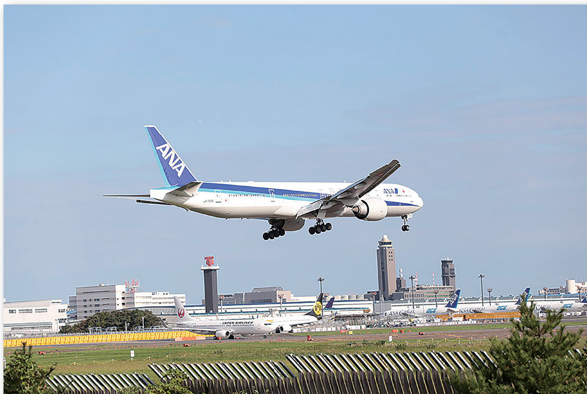
成田国際空港